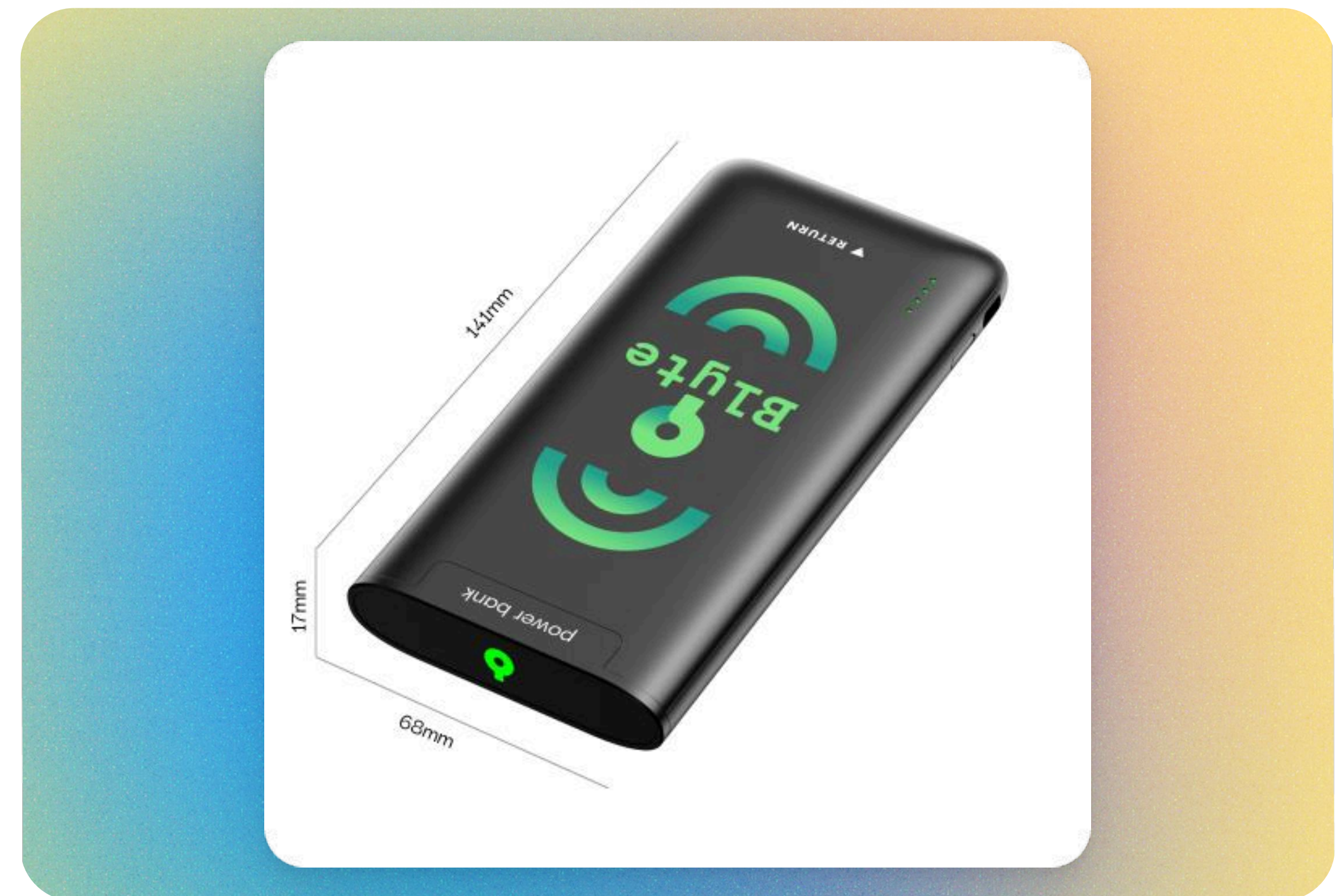
Batterie externe Blyte Batterie externe avec câble fourni