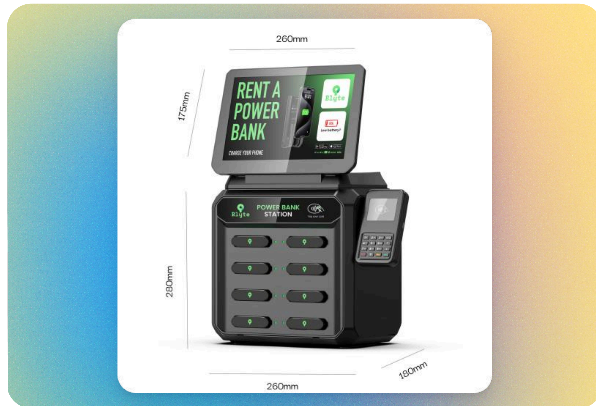
Station Blyte à 8 emplacements Idéal pour les bars et restaurants